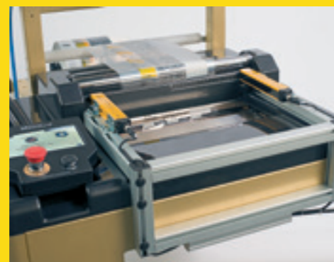
Start ciclo da inserimento prodotto