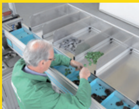
Tavolo multiscparti e tappeto a passi