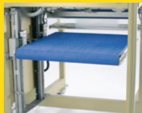
Tappeto prodotti pesanti e uscita