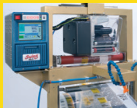
Stampante TTR su film